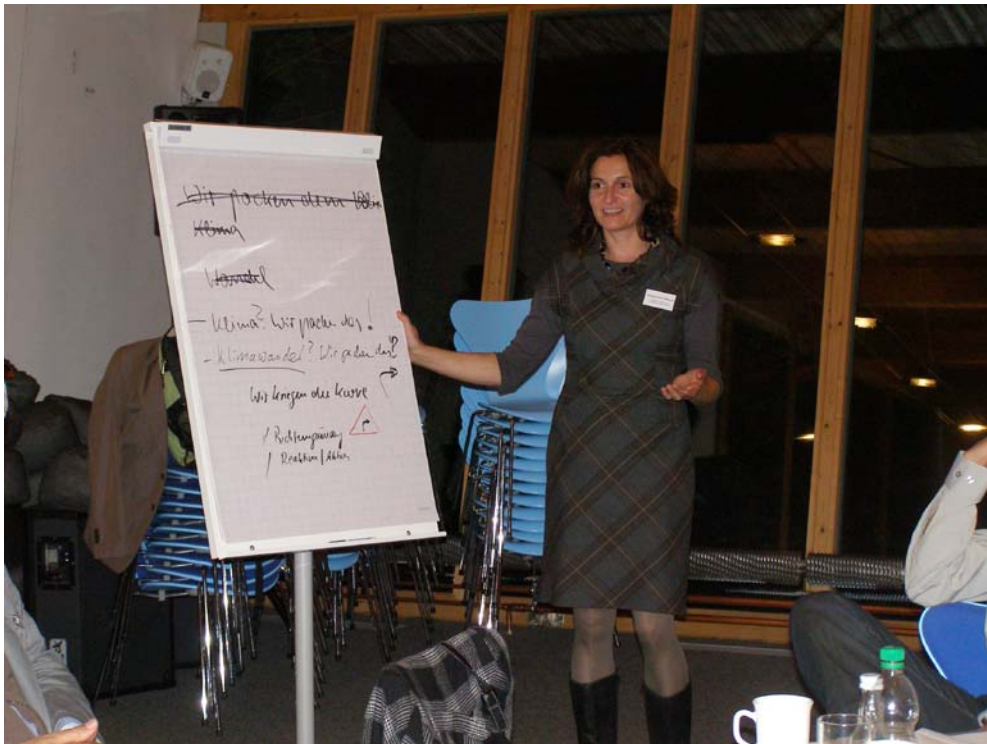
Zum Umgang der Zivilgesellschaft mit dem Klimawandel in der Emscher-Lippe-Region